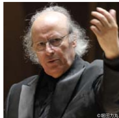
エリアフ・インバル