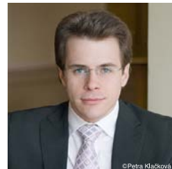
ヤクブ・フルシャ